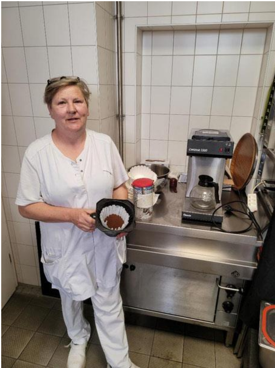
Birgitt freut sich über